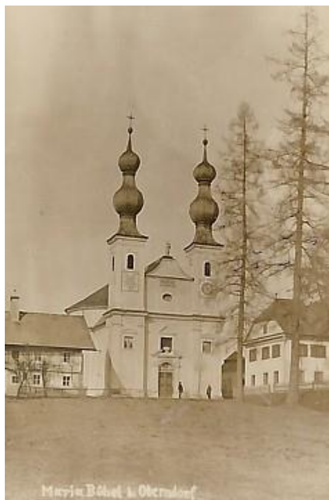
Postkarte im Archiv Stadtpfarre Oberndorf b. Sbg.