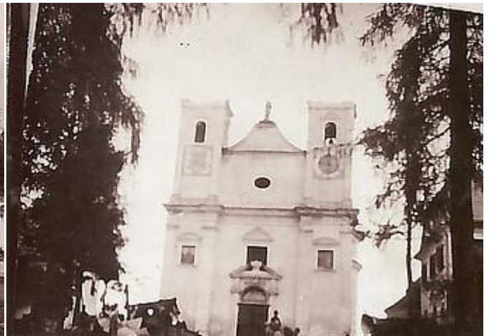
Die Wallfahrtskirche nach dem Sturm